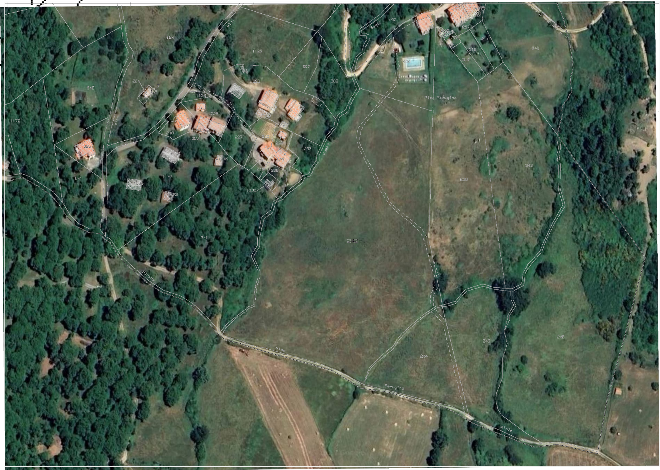
Estratto mappa catastale sovrapposto a ortofoto Scala 1:2000